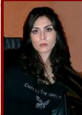
Direzione Artistica Michela Diamanti