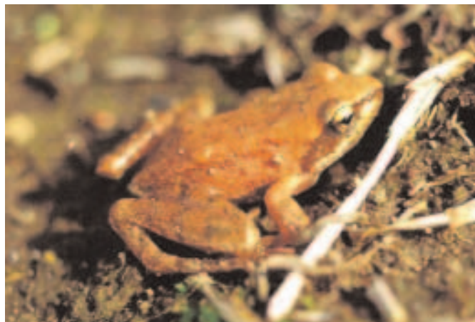
La rana appenninica ( Rana italica )

Quello del Pozzo del Merro è il primo rinvenimento per