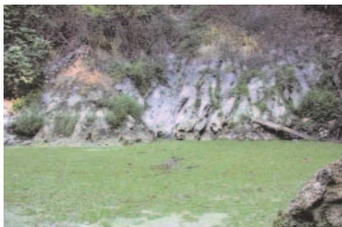
Il lago del Pozzo del Merro (foto settembre 2003)