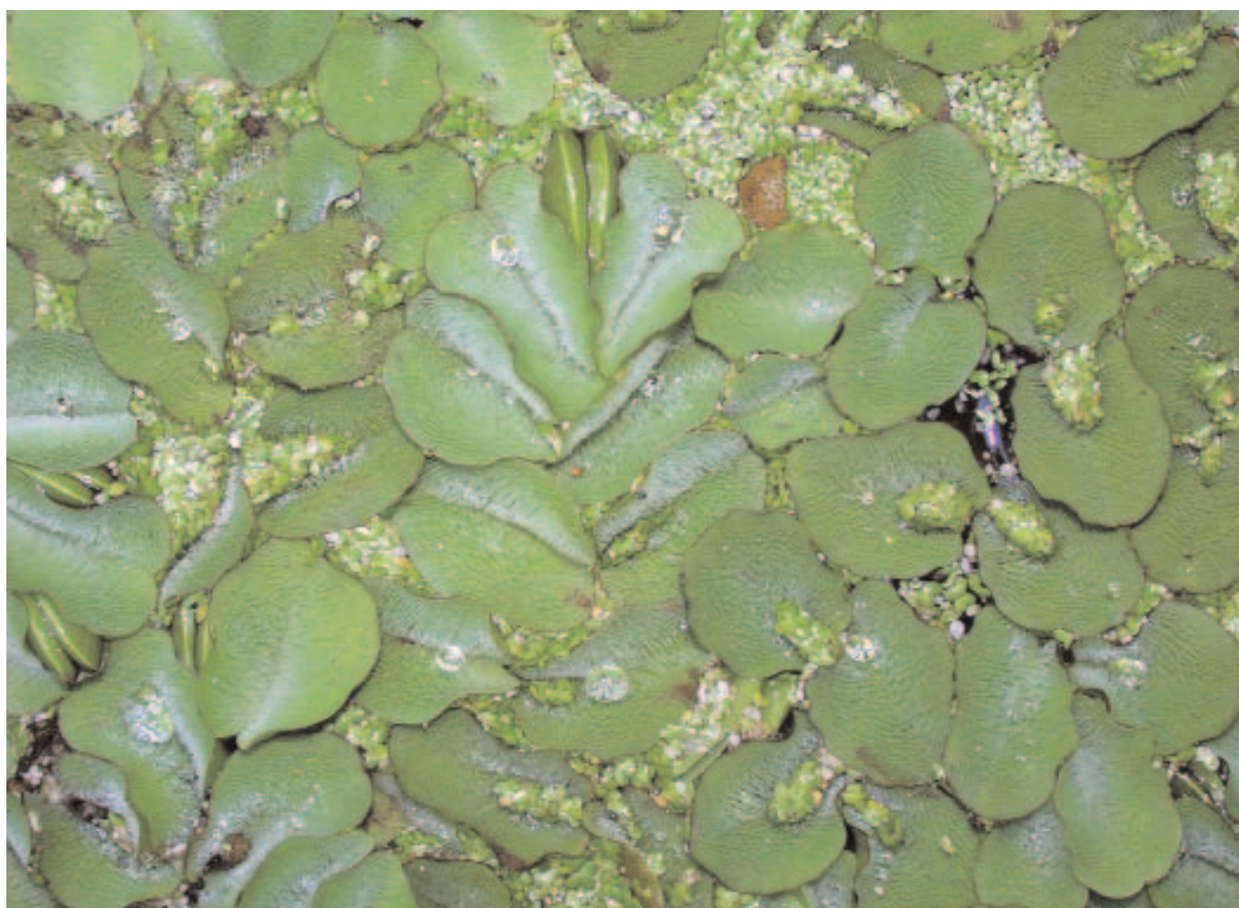
S. molesta fotografata al Pozzo del Merro

SEGRE A. G., 1956 - Toponomastica del fenomeno carsico nell'Appennino centrale . Atti del VII Congresso Nazionale di Speleologia, Memoria III di Rassegna Speleologica Italiana e Società Speleologica Italiana, Como, pp. 122-131.