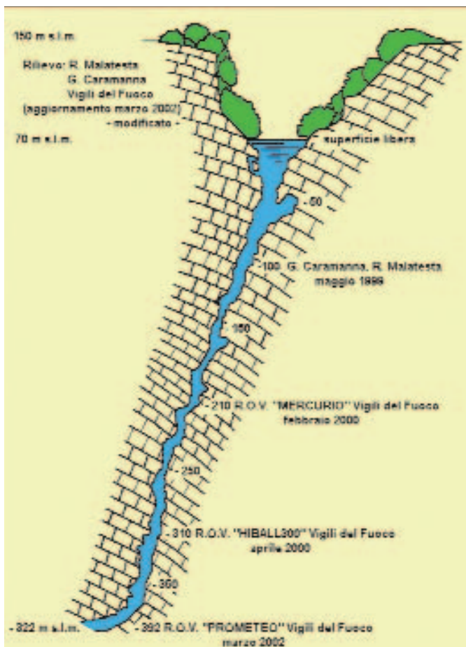
Rilievo realizzato in seguito alle esplorazioni effettuate

L'intera superficie lacustre, ricoperta fino a pochi anni fa da un verde ed uniforme tappeto di lenticchia d'ac-