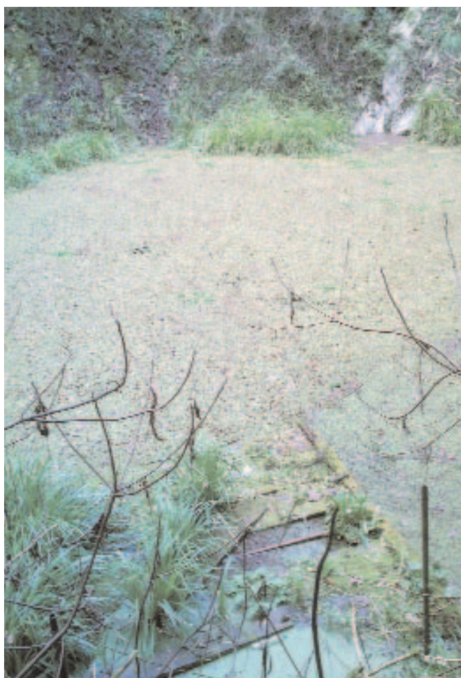
Gennaio 2006: la salvinia ricopre la superficie del lago

L'accesso alla cavità, per il suo valore scientifico e la sua fragilità, oltre che per ragioni di incolumità pubblica, è oggi precluso.